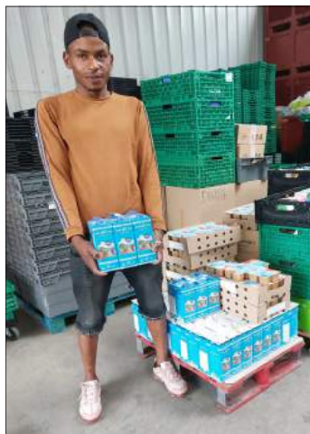
Distribution de lait à une de nos associations

- Grâce à l'opération « Plein Lait Yeux », la BAI a bénéficié d'un don de plus de 10 000 litres de lait 100% ISERE. 2000 litres, rétrocédés à la BAI, ont été achetés par le Département de l'Isère, Grenoble Alpes Métropole et la Communauté de Communes du Grésivaudan. Une belle initiative qui sera reconduite à la rentrée de septembre en espérant que ce partenariat se pérennise. https://www.agriculture-dromoise.fr/articles/05/03/2022/Plein-lait-yeux-un-lait-100-Isere-68650/