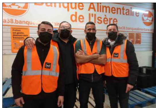
Les équipes de Becton Dickinson (ci-dessus), du Crédit Mutuel et un équipage d'Emmaüs