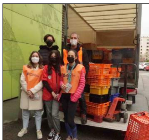
La députée Camille Galliard-Minier au magasin Carrefour Meylan