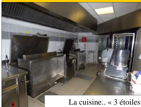
La cuisine.. « 3 étoiles »

Si vous souhaitez participer, il n'est pas trop tard pour vous faire connaître. Du lundi au jeudi inclus, toute l'année. Deux tranches horaires d'activité : 13h-16h et 16h-19h.