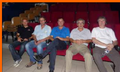
La délégation BAI avec deux responsables d'Emmaüs

Emmaüs en France, c'est plus de 120 communes où vivent et travaillent plus de 4000 compagnons qui refusent toute subvention et qui ont la dignité de ne vivre que de leur travail.