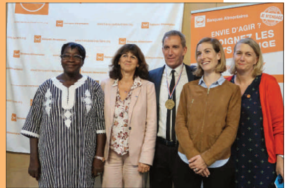
Amis, bénévoles de la BAI et élus étaient présents pour cette cérémonie conviviale