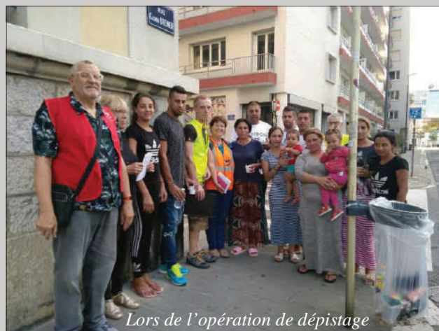
Lors de l'opération de dépistage

(*): La PASS est une permanence d'accès aux soins de santé : permanences médicales, assistante sociale et infirmière. Ils font l'orientation des patients vers les suivis et examens complémentaires.