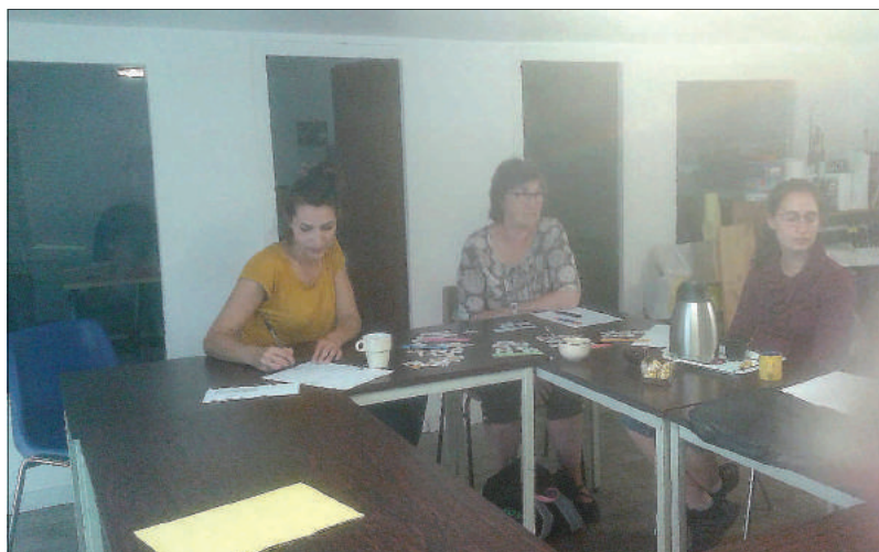
Dans les locaux de l'association Amandine