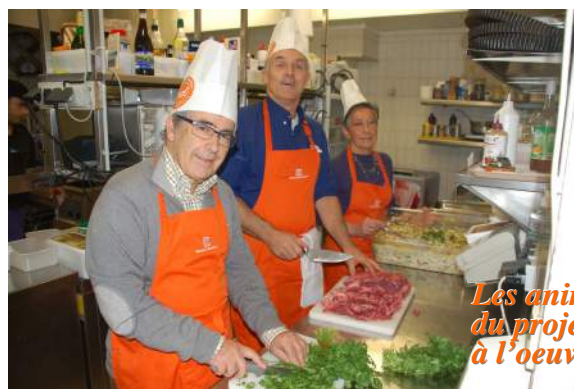
Les animateurs du projet... à l'oeuvre