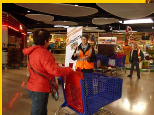
France 3 Alpes en direct