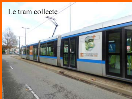
Le tram collecte

A l'heure de la mise en page de ce BAI Infos, la BAI n'a pas encore reçu tous les détails des retours des associations du Nord Isère qui « conservent » les produits de la Collecte. On peut donc penser que le chiffre final sera légèrement différent et sans doute un peu supérieur. Après l'année « exceptionnelle » que fut 2013 et sa campagne particulière sur le lait, 2014 ne