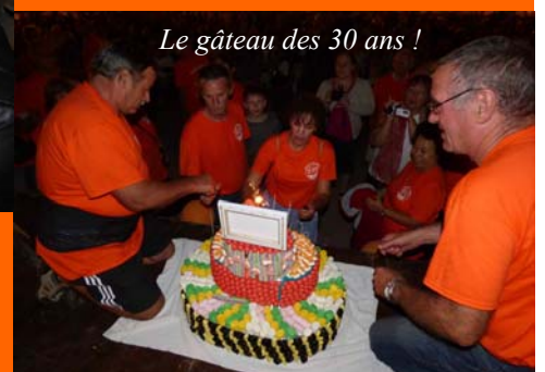
Le gâteau des 30 ans !