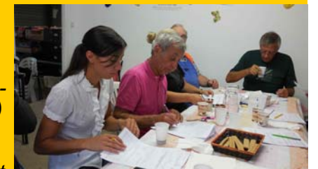
Les goûteurs à l'œuvre