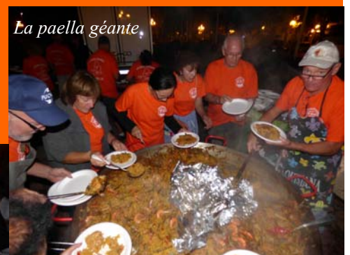
La paella géante