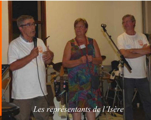
Les représentants de l'Isère