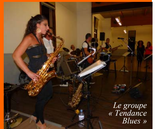
Le groupe « Tendance Blues »

visite de Sanary le samedi matin et découverte des calanques en bateau. Pour les plus courageux journée de randonnée dans les calanques de Cassis. Mais ce n'est pas tout ! Le samedi soir, sur la place d'Armes de Toulon, réquisitionnée pour cette bonne cause, une gigantesque paella a été préparée et servie par les bénévoles de la BA83 pour les 220 invités des Banques, mais aussi pour les as-