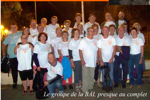
Le groupe de la BAI, presque au complet

Le défi est lancé à la Région Centre-Est pour renouveler ce genre de rencontre.